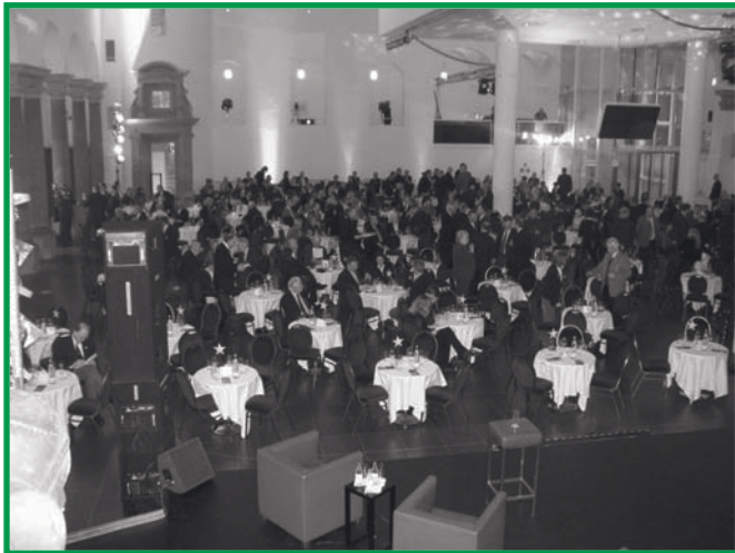
Gäste der Veranstaltung „Sport trifft Kultur“