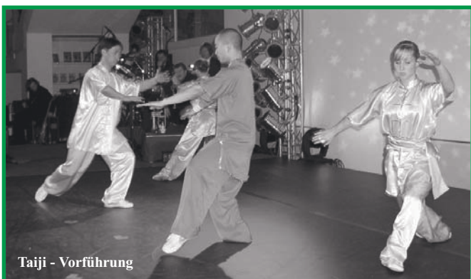
Taiji - Vorführung

rhein-Westfalen für ihre Leistungen als Verein und für den Breitensport. Für beste Unterhaltung sorgten während des Abends verschiedene Stars aus Sport und Kultur. Unter anderem Veniamin - der unglaubliche Spiralmensch, Starlight Express - das rasanteste Musical der Welt, Take Two - Artistical Cocktails at its best, Rope