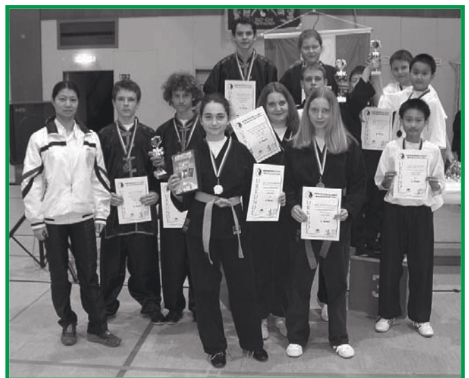
Siegerehrung Synchronform Jugend