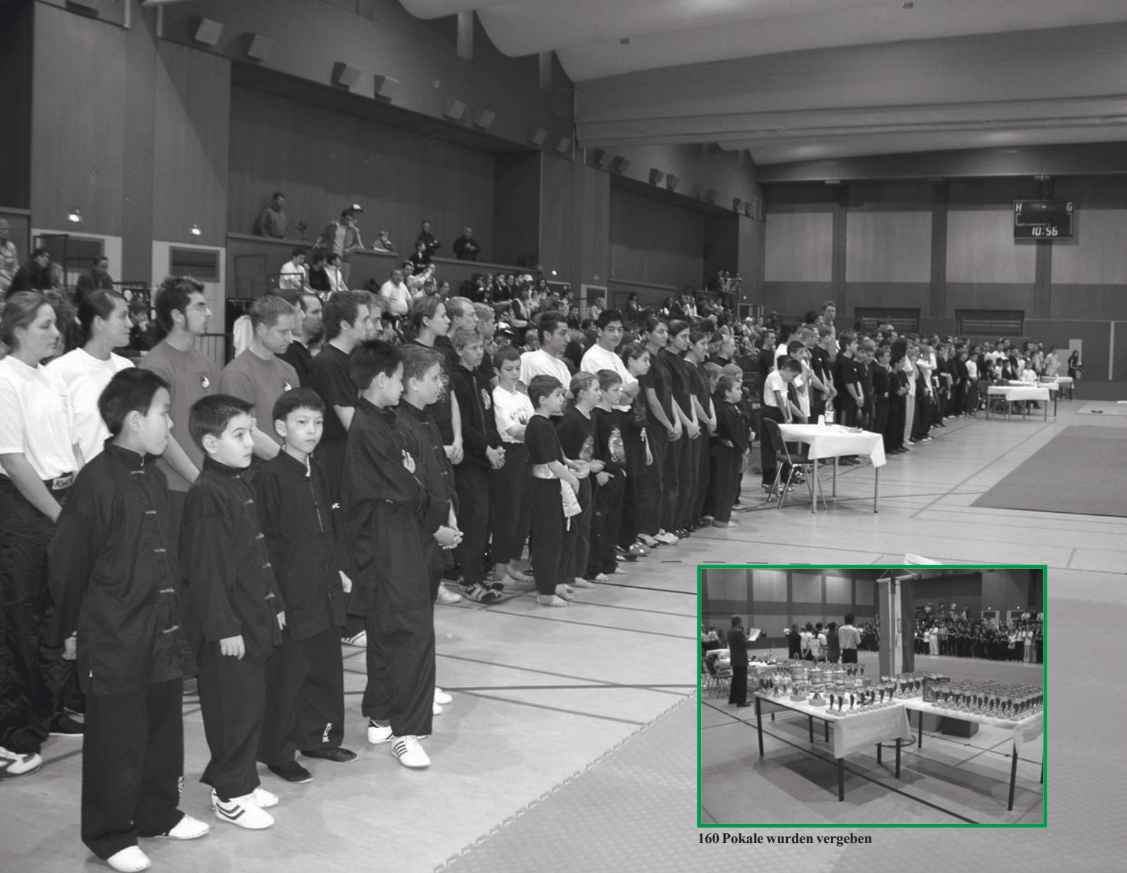
160 Pokale wurden vergeben